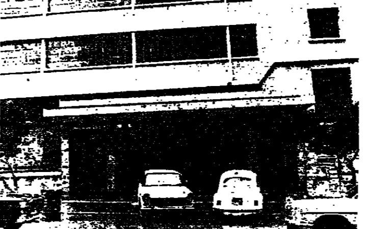
مدخل الجامعة العربية

هل تبت الدراسة لإنشاء كلية الطب في الجامعة؟ بالنسبة لكلية الطب نحن ندرس أمرين: الأول - حاجة المنطقة لهذا التخصص وإنشاء كلية الطب الثاني - أن تسرع الكليات العلمية الأكاديمية والمادية بإنشائها ونتيجة الدراسة كانت حتى الآن إيجابية، ونسباً بإنشاء كلية الطب والكليات التطبيقية الأخرى تسروقت قريباً.